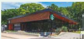
スターバックスコーヒー