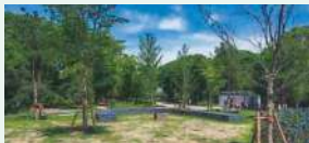
ポタニカルショーケース