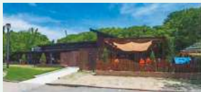
ポーネルドプレイヴィル